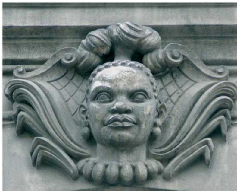
Mascarons de la ville de Nantes, allée Brancas. Présentes sur les frontons des maisons des commerçants nantais, ces effigies reprennent parfois des visages d'esclaves africains.