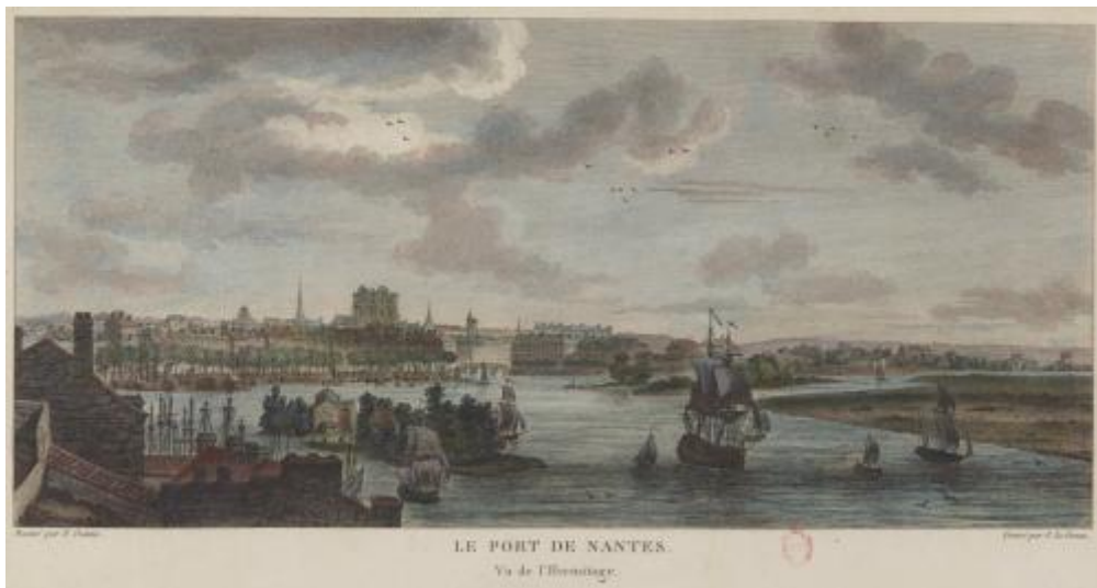
Le port de Nantes en 1776. Planche tirée des Nouvelles vues perspectives des ports de France dessinées pour le Roi par M. Ozanne. Gravées par Y. Le Gouaz en 1776.